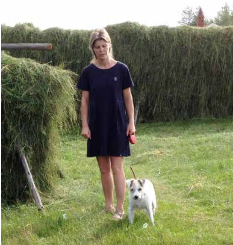
Ja, Keste, så dokumenterad å lissrackan "Loppan".