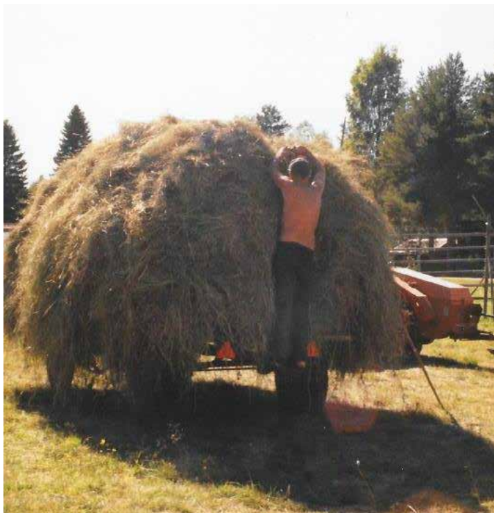
Jan klisser up fe å fest repä å bindståndje