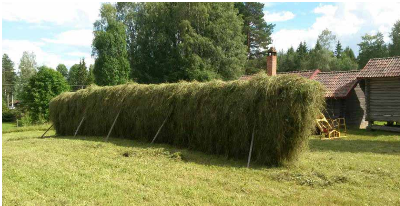
Södra Selbäck 2014, fyr gov.