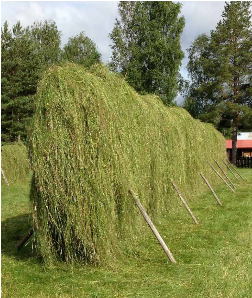
Mellersta Selbäck 2015, sex gov