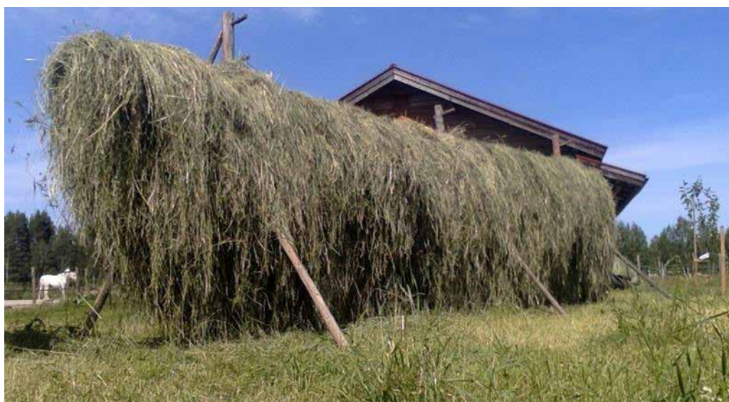
Färdun esja åjtå fastlåsning, ema i Mellerasta Selbäck 2018.