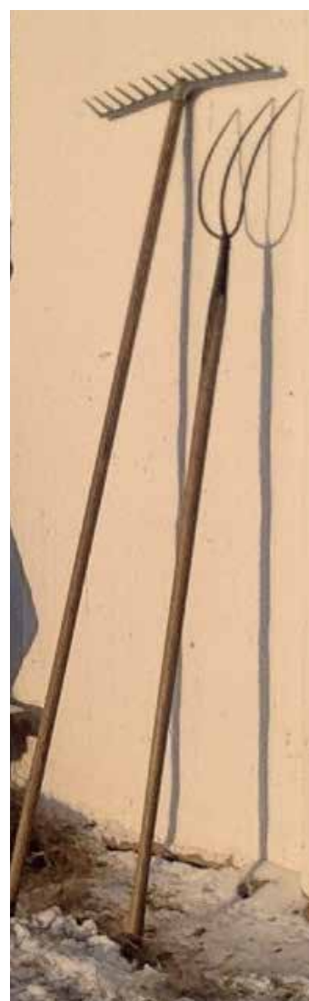
Erju å gafflan