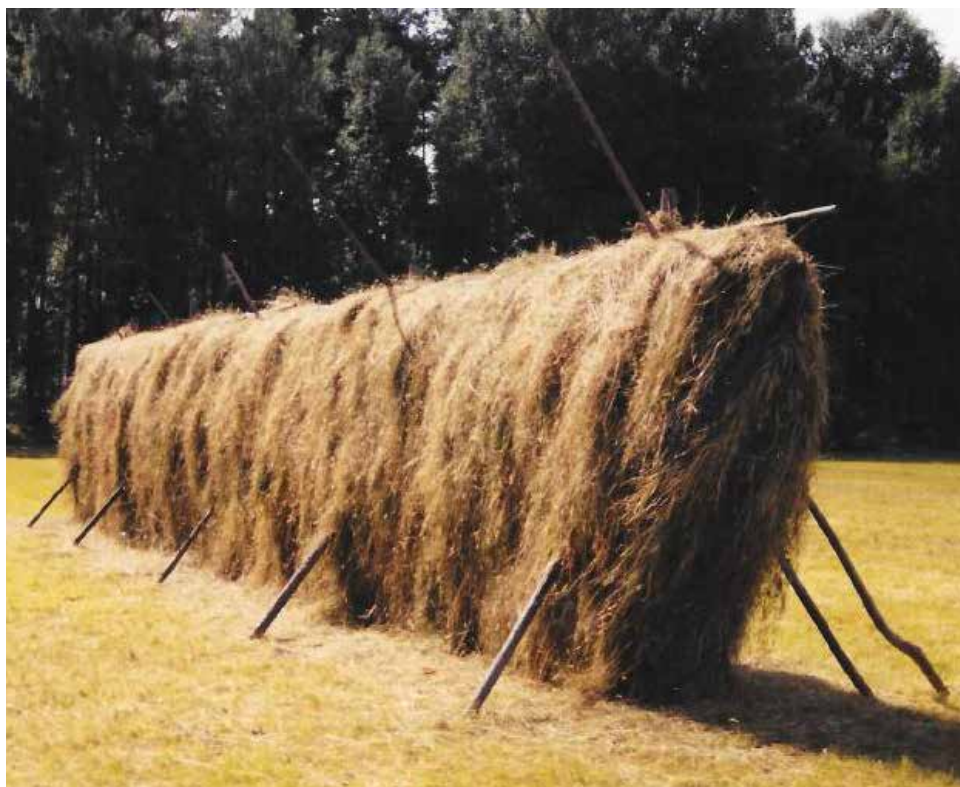
Yvraden 2015, fyr gov.