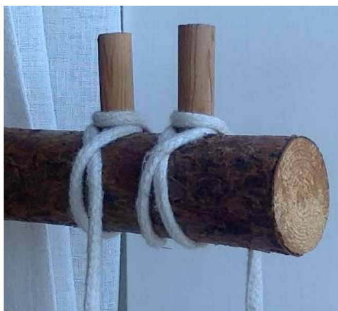
modell, ändan åv bindståndje