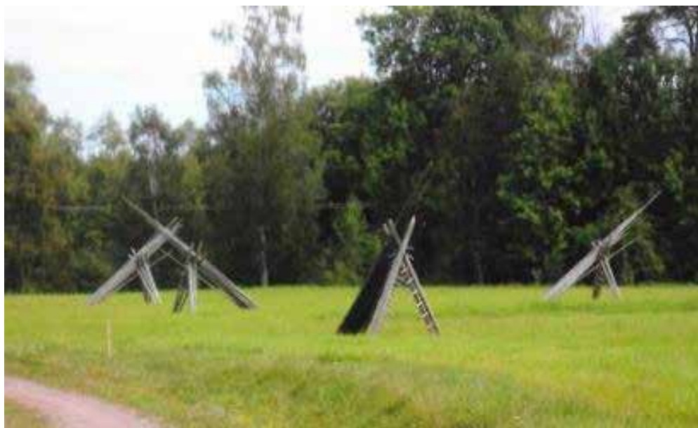
Stångkaller, M. Selbäck 2014

Ed a tålas um att tysker int tosst anfall svensker under oder werldskrijå när dem såg stångkaller åjtå lindur. Frå luften såg stångkaller åjt åldes läså kanoner.