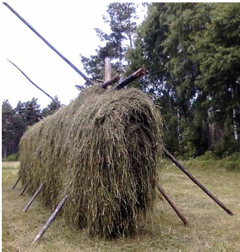
Färdun esja min fastlåsning. Kolugn 2017