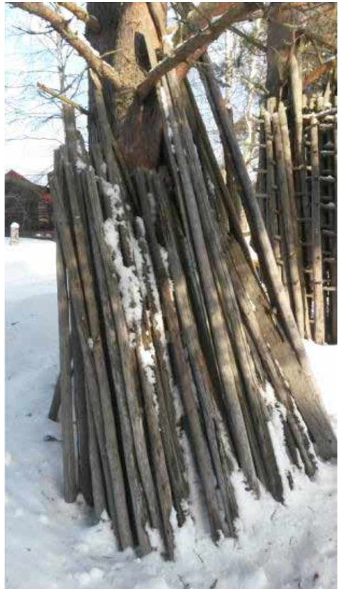
Stöttör eld stode å kråkåer.

Ta bort bartje min jen barkspådå å wess til kråkåer i rotåndan min je öxa.