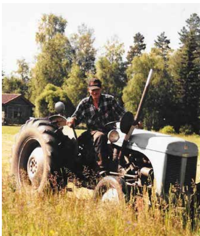
Jan slår lindu min jett slåtteraggregat å grållan. Mellersta Selbäkk 2014.

Om det är mycket varmt kan du nog hässja direkt. Hö får inte bli för torrt, då blir det glatt och svårare att få upp, och det kan halka ur hässjan.