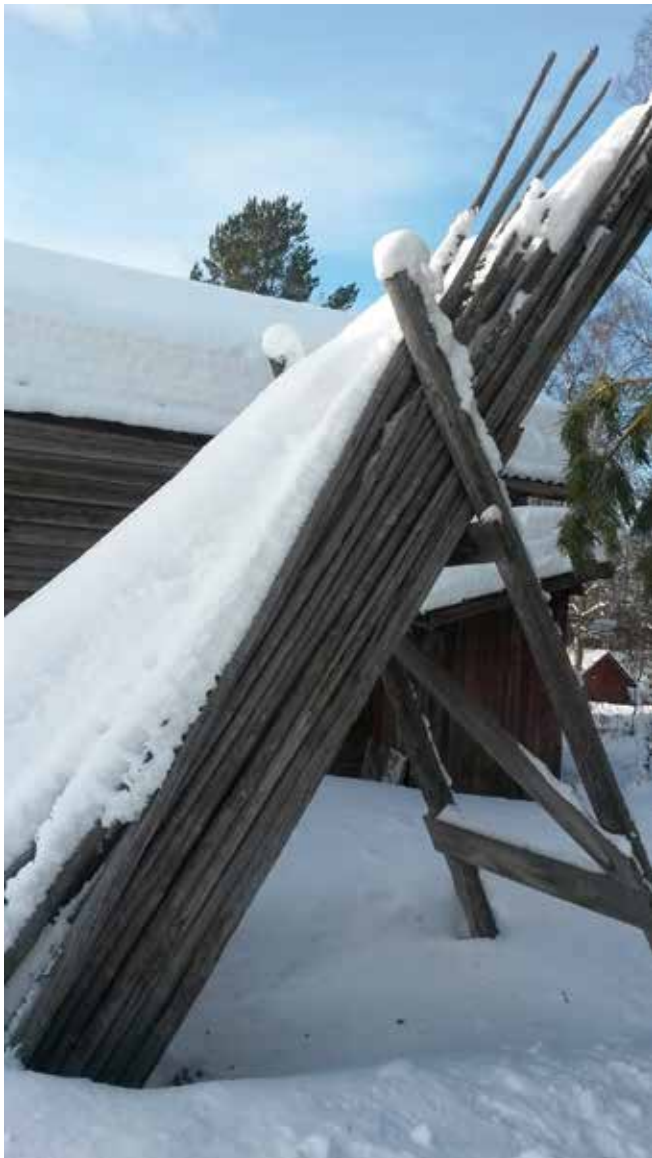
Stänger eld rode.