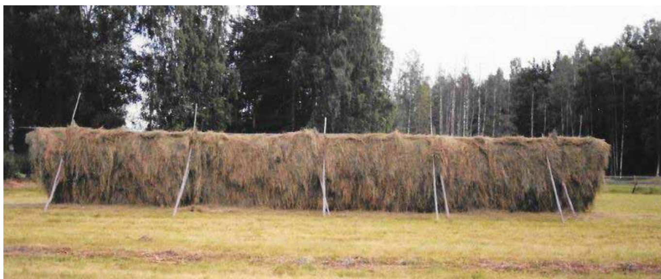
Yvraden 2015, fyr gov.