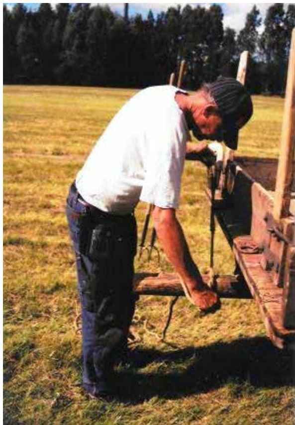
Jan knåjtfast krotjen å trillu.