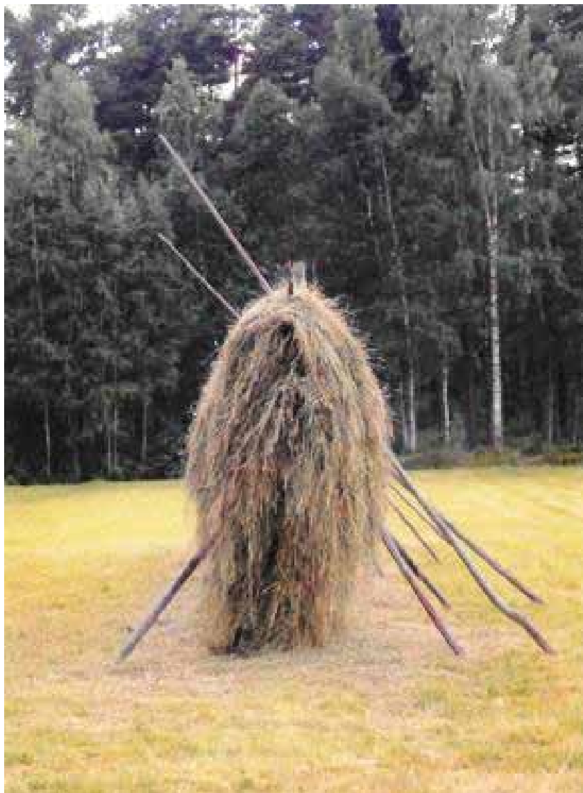
Yvraden 2015, fyr gov.