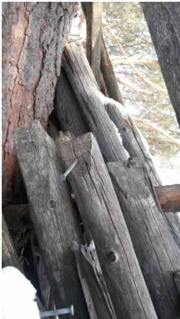
Stode eld stöttör.

Till stöden använder man ca 2-2,2 m långa granstörar med en dimension runt 5 cm. Yxa till en flat, något skålförmad del i toppen så att den passar bra in mot kraken och kan fästas fint. Se bild.